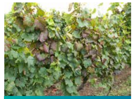
Simptomi zlatastog žutila koje prouzrokuje cikada

Direktne štete od ishrane ovih cikada su zanemarljive, ali su indirektne štete izuzetno velike jer je cikada vektor fitoplazme Flavescence doree (FD).