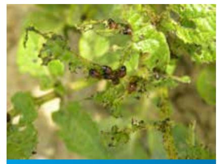
L2 stadijum larve krompirove zlatice

Insekticid Alverde 240 SC se vezuje za voštani sloj lista, čime je obezbeđena visoka otpornost na spiranje kišom.