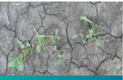
Štete od iskopavanja i kidanja biljaka

pričinjavale su ptice (čvorci) koji su u jatima sletali na useve i otkopavali biljke, otkidali lišće i uništavali velike površine pod usevom.