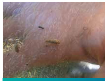
Cikada vinove loze

Prvi hemijski tretman protiv cikada treba uraditi kada su one u III larvenom uzrastu (period oko 5. -10. juna), a drugi 10 dana posle prvog tretmana (oko 20. juna).