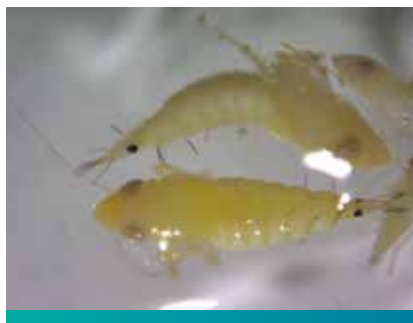
Larva cikade vinove loze

svoje mane i prednosti. Mana je to što je koncentrisana ishrana samo na vinovoj lozi i zbog toga dolazi do jako brzog širenja fitoplazmi. Prednost ovakvog života cikade je u tome što se suzbijanje radi relativno brzo i lako. Sve cikade su uvek na vinovoj lozi tako da se sa hemijskim tretmanom može suzbiti veliki deo populacije.