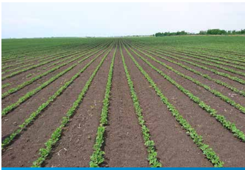
2017. polja u Vojvodini – primena herbicida Proman ® u soji

sloju zemljišta formira, pre svega za širokolisne korove, neprobojni herbicidni film. U kontaktu sa njim korovi ga usvajaju, a usev raste i razvija se nesmetano. Pored toga što herbicid Proman ® korovi usvajaju preko korena, oni ga usvajaju i preko lista, te oni ponici korova koji su se zadesili u toku tretmana mogu biti uklonjeni.