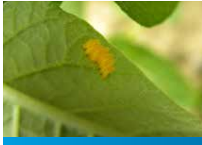
Jaja krompirove zlatice

da je određeni broj jedinki preživeo, proizvođači koriste mehanizam povećanja doze, čime stvaraju još otporniju populaciju na celu grupu insekticida sa istim mehanizmom delovanja.