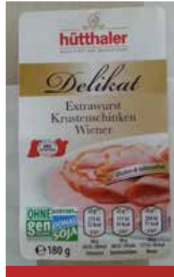
Dunav Soja oznaka kvaliteta na proizvodima

de koji poseduju sledljivost i kontrolu svakog učesnika u lancu vrednosti od njive do trpeze. Kupovinom proizvoda sa Dunav Soja oznakom kvaliteta, potrošač direktno podržava domaću proizvodnju i naše proizvođače i prerađivače soje, kao i proizvođače i prerađivače mesa, mleka i jaja.