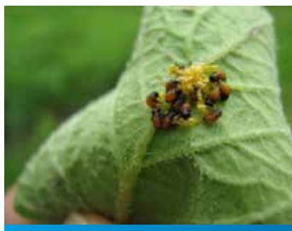
L1 stadijum larvi krompirove zlatice

Odgovor na ovo pitanje dala je kompanija BASF uvođenjem preparata Alverde 240 SC koji sadrži noviju aktivnu materiju metaflumizon koja spada u grupu semikarbazona.