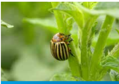
Imago krompirove zlatice